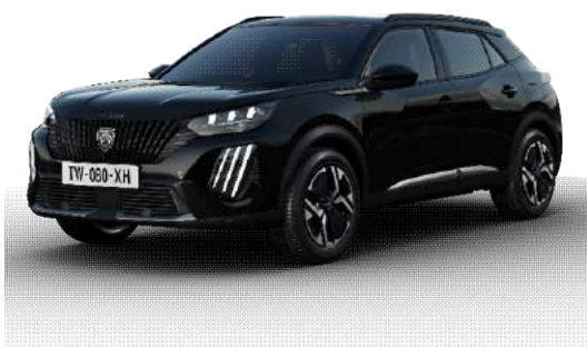
Perla Nera black